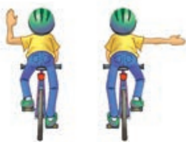
Tourner à droite