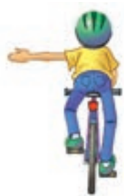
Tourner à gauche